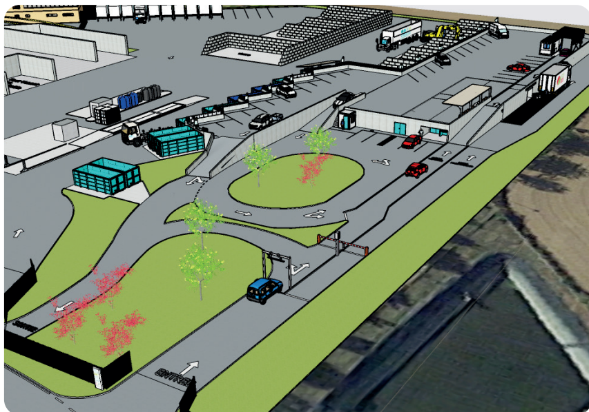
Vue en 3D de la future déchèterie.

Sa nouvelle configuration permettra d'accueillir dans de meilleures conditions les nombreux usagers qui fréquentent cette déchèterie.